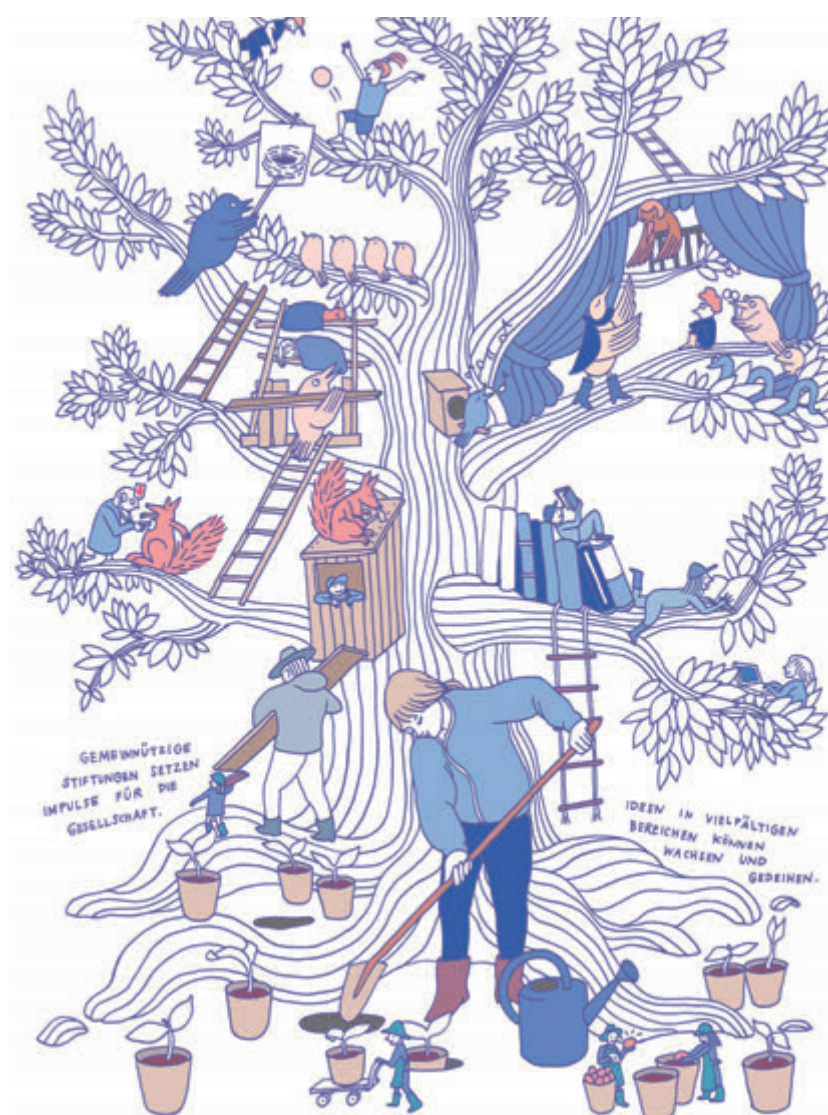
Die Protected Cell Company ist eine kostengünstige Möglichkeit, eine gemeinnützige Einzelstiftung zu errichten.

Die Protected Cell Company (PCC) ist eine grundsätzlich für alle juristischen Personen mögliche Organisationsform, die aus zwei Komponenten besteht: einem sogenannten «Kern» sowie einem oder mehreren sogenannten «Segmenten», die organisatorisch voneinander und vom Kern getrennt sind. Bezüglich der eingangs erwähnten Problemstellung können